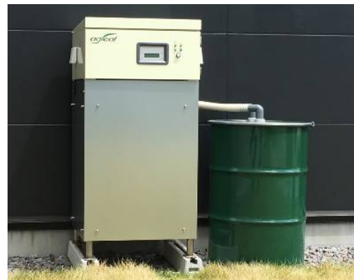
「CO 2 貯留・供給装置：FC3040（600坪用）」 制御ユニットと貯留タンクユニット

http://www.futabasangyo.com/cultivation/